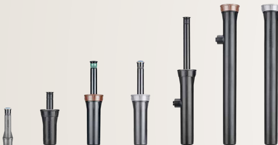
Imagen : Difusores PRS40 aéreo, Pro-Spray 5 cm, PRS30 y PRS40 10 cm, Pro-Spray 15 cm, y PRS30 y PRS40 30 cm

ajustables Pro, con toberas fijas y con los MP Rotator. Todos los modelos incluyen un tapón de purga, fácil de usar, para evitar residuos y atascos. El Pro-Spray de Hunter es compatible con la mayoría de toberas de rosca hembra del mercado, ofreciendo una gran flexibilidad.